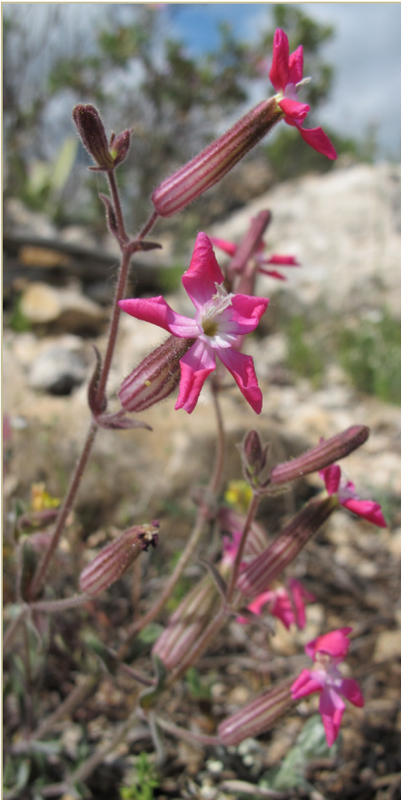
Fig. 4. Silene psammitis , procedente de Jarafuel (Valencia).

VALENCIA: 30SXJ5934 , Jarafuel, Muela de Juey, 1003 m, claros de matorral con pino carrasco, 12-V-2013, M.P. (VAL 219967) (fig. 4); 30SXJ6045 , Cofrentes, Borregueros, 753 m, ibíd. , 24-V-2013, M.P. (v.v.); 30SXJ6036 , Jarafuel, Muela de Juey, 958 m, ibíd. , 27-V-2013, M.P. (v.v.); 30SXJ6135 , ibíd. , 978 m, ibíd. , 20-VI-2013, M.P. (v.v.); 30SXJ5634 , Jarafuel, fuente de las Doncellas, 930 m, umbría de pinar con más densidad de vegetación, 27-VI-2013, M.P. (v.v.); 30SXJ6137 , Jarafuel, Muela de Juey, 955 m, claros de matorral con pino carrasco, 30-IV-2015, M.P. (v.v.).