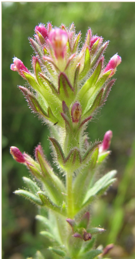
Fig. 3 Parentucellia latifolia , procedente de Jalance (Valencia).

encontró en la Laguna de San Benito, que habitualmente permanece seca y totalmente ocupada por cultivos, cuando recuperó temporalmente la lámina de agua tras una excepcional tormenta ocurrida en agosto de 2015, y que se mantuvo hasta mediados de octubre de ese mismo año.