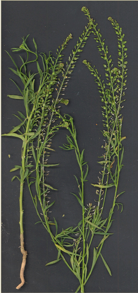
Fig. 2. Lepidium ruderale , recolectado en Buñol (Valencia)

No aparece indicada esta especie en la provincia, ni en el BDBCv ni en el vol. 1 de Flora Valentina . Lo cierto es que la población, aunque bien asentada, lo hace en una zona recientemente removida para infraestructuras deportivas.