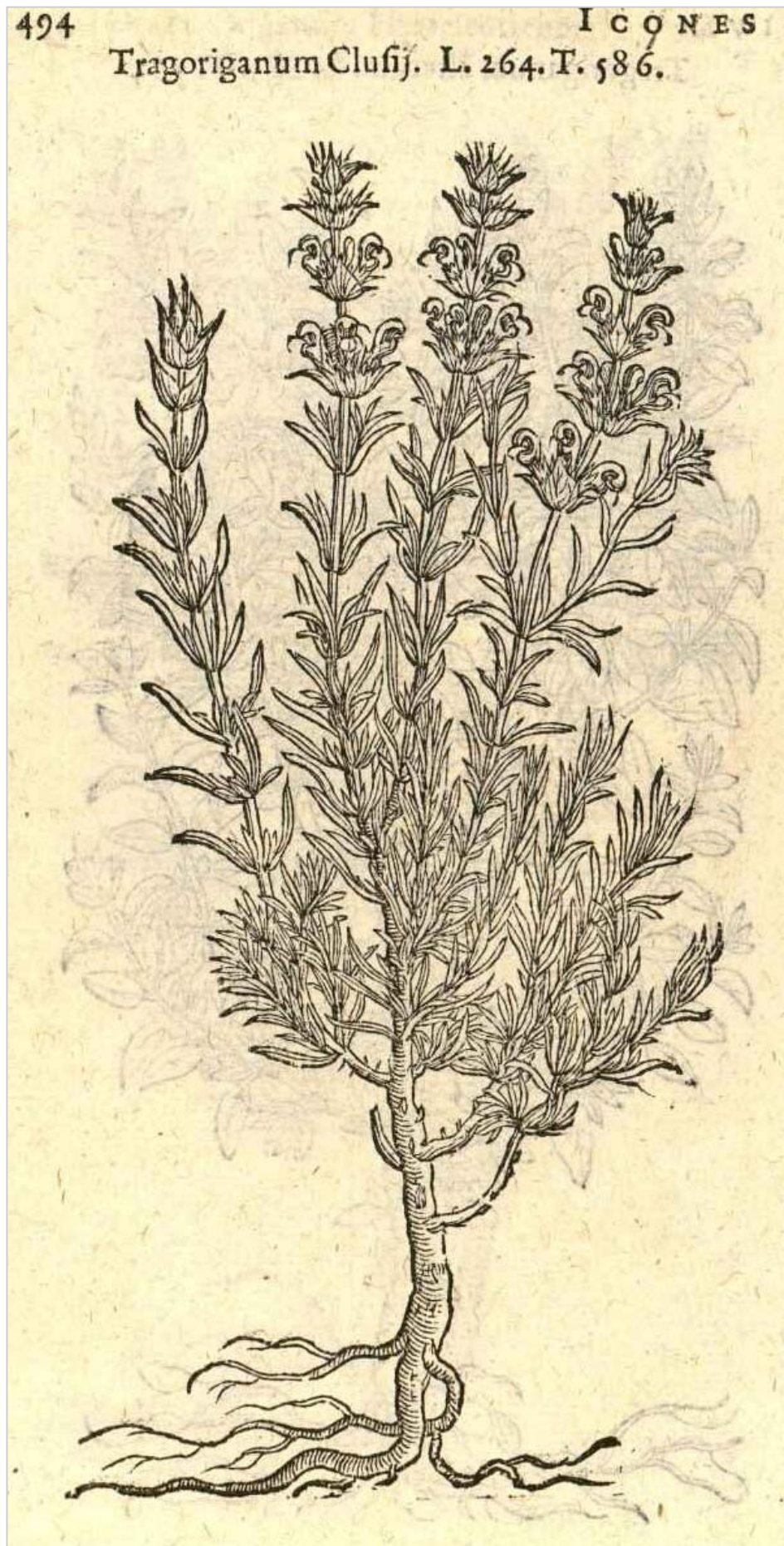
Fig. 1. Lectotipo de Sideritis tragoriganum Lag., ilustración “ Tragoriganum Clusii L. 264. T. 586” (LOBELIUS, 1591: 494).