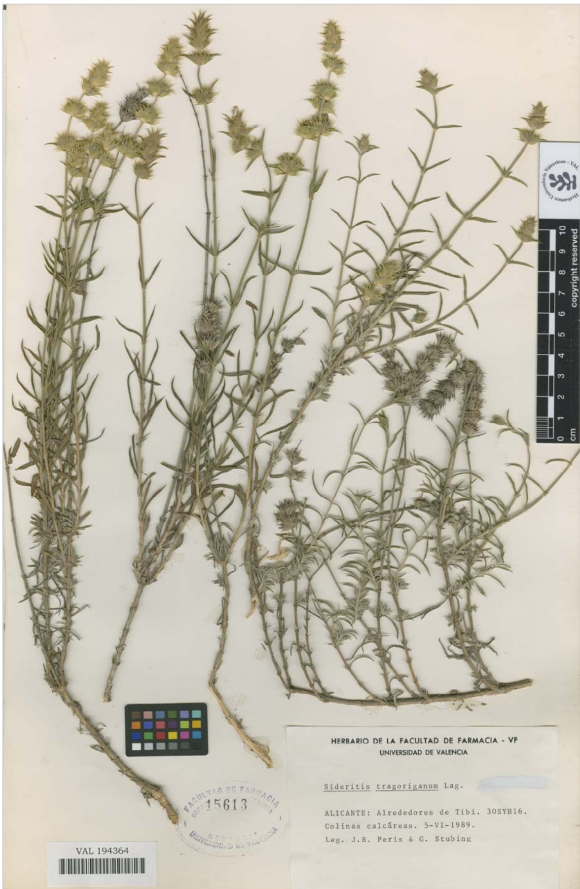
Fig. 3. Epitipo de Sideritis tragoriganum Lag., VAL 194364 (ex VF 15613) [hoja 1].