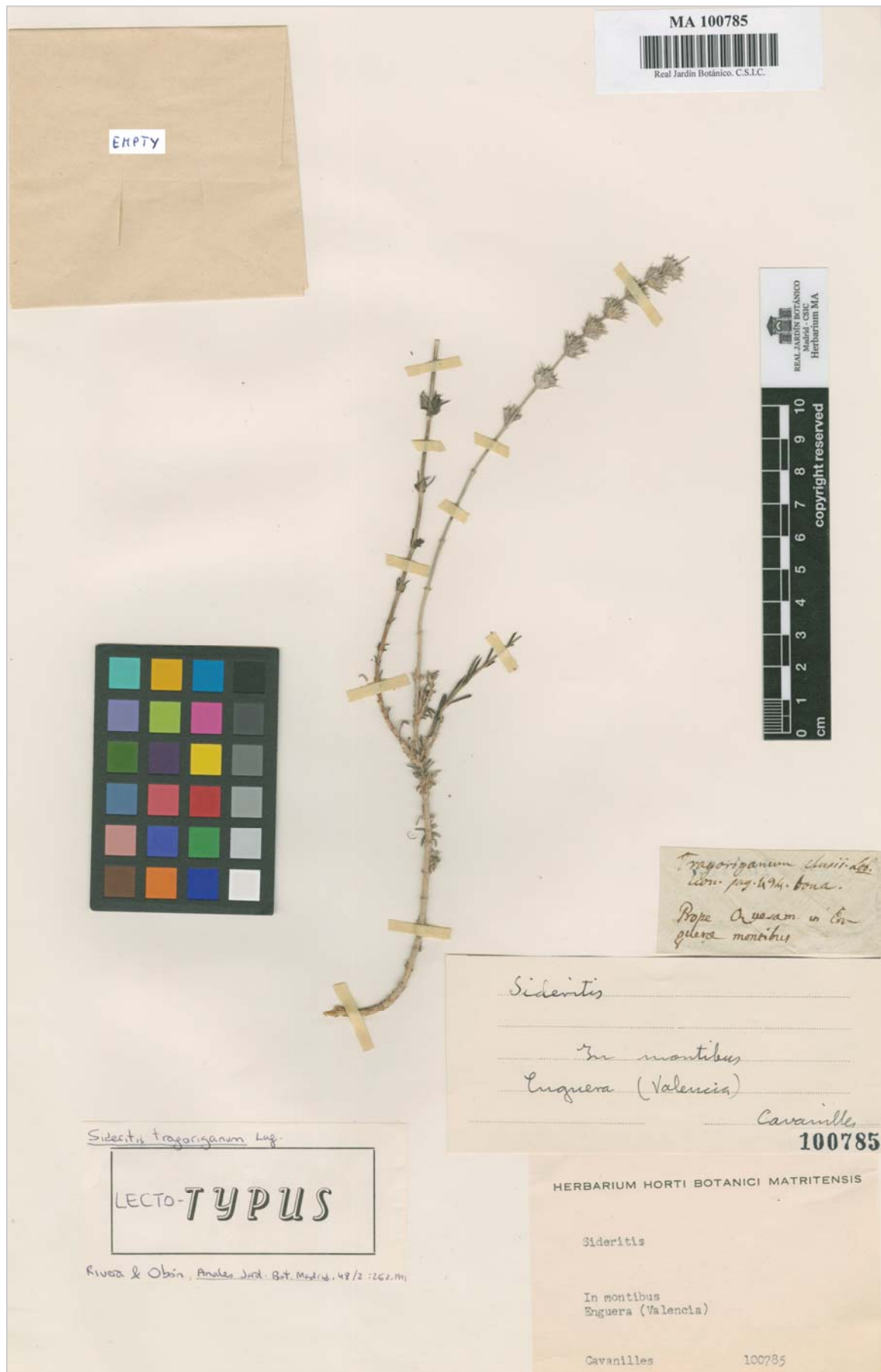
Fig. 2. Material original de Sideritis tragoriganum Lag., MA 100785. (Fotografía por cortesía del herbario MA, reproducida con permiso).