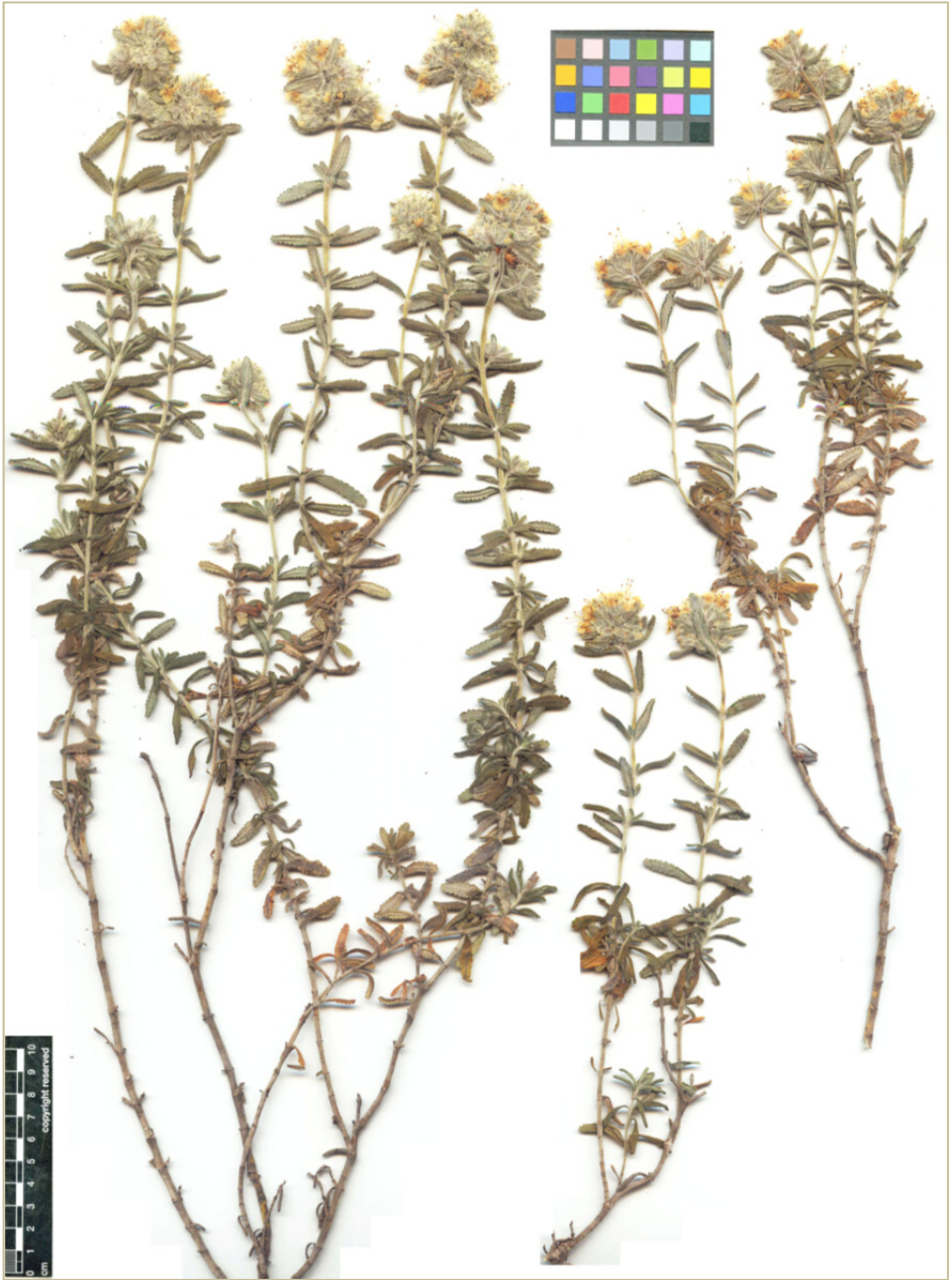
Fig. 3. Teucrium dunense subsp. sublittoralis , Náquera, Pla del Estepar (Valencia), 30SY206894, 105 m, 21-V-2012, P. Pablo Ferrer-Gallego & Inmaculada Ferrando.