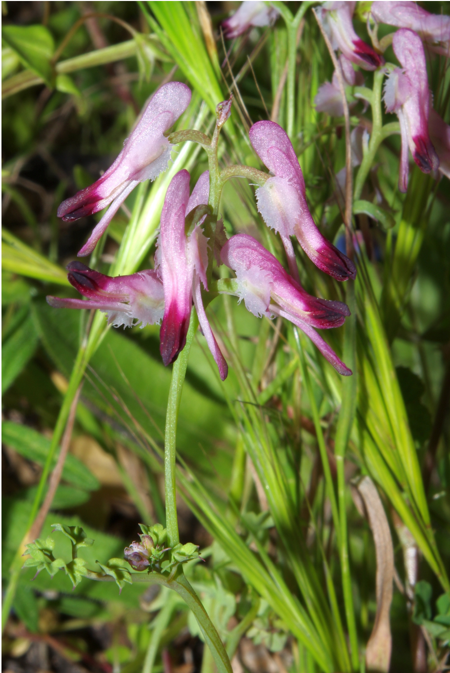
Fig. 1. Detalle de Fumaria melillaica , detectada en Cabo Cope (Águilas, Murcia).