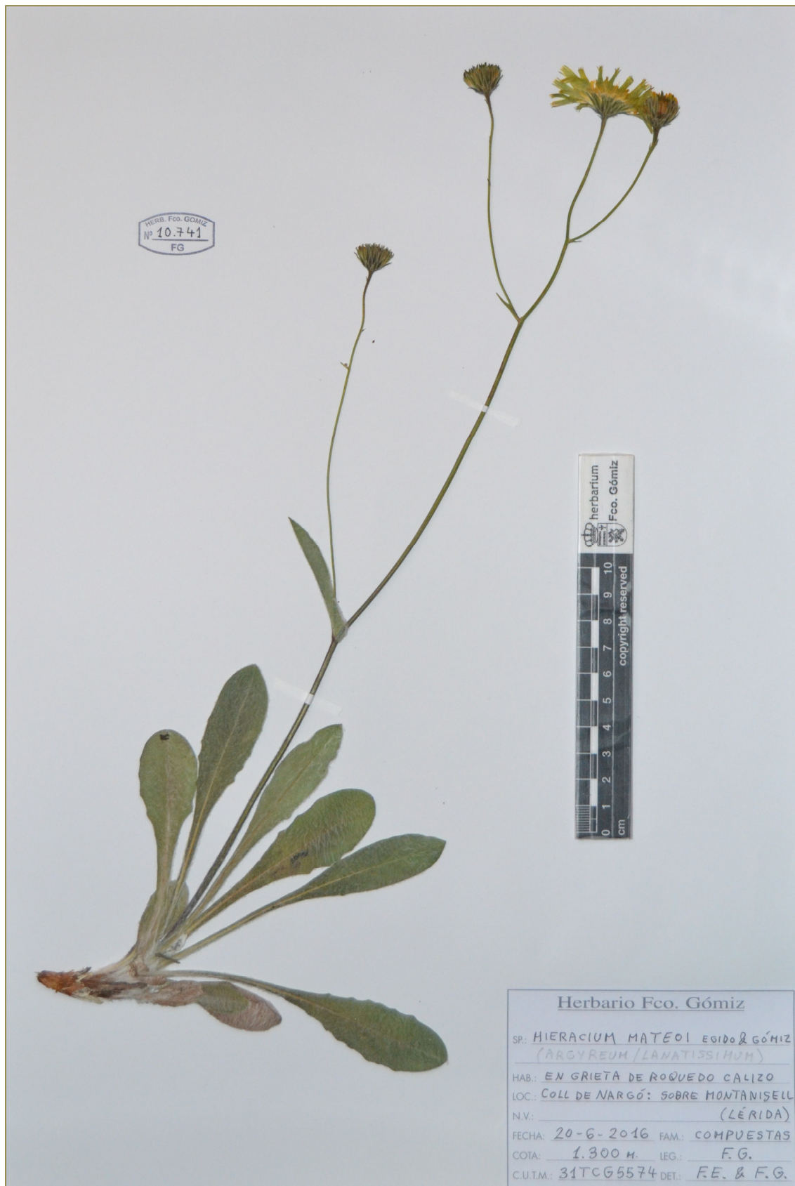
Fig. 1: Typus de Hieracium mateoi , procedente de Montanisel (Lérida).